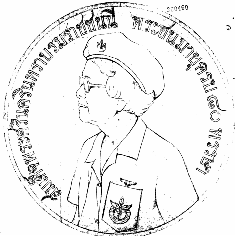
ภาพ ๑.๔ ผินพระพักตร์ทางเบื้องขวา