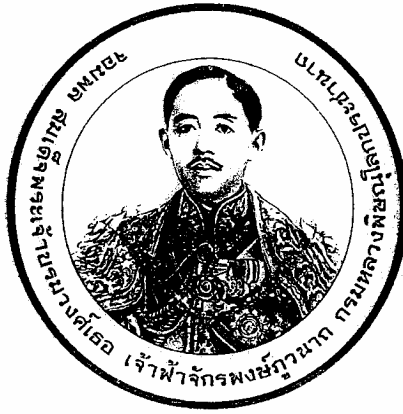
ภาพ ๑.๑ พระพักตร์ตรง

๑) กรณีพระพักตร์ตรง (เห็นพระกรรณทั้ง ๒ ข้าง) หรือพระพักตร์หันไม่เกิน ๔๕ องศา เช่นนี้จะไม่มีการบรรยายถึงพระพักตร์ เมื่อบรรยายบริเวณกลางเหรียญแล้วจึงบรรยายฉลองพระองค์เป็นส่วนถัดไป เช่น “กลางเหรียญมีพระบรมรูปพระบาทสมเด็จพระปรมินทรมหาจุฬาลงกรณ์ พระจุลจอมเกล้าเจ้าอยู่หัว และพระบาทสมเด็จพระปรมินทรมหาภูมิพลอดุลยเดช ทั้งสองพระองค์ทรงฉลองพระองค์สากล...” (เรื่องเสร็จที่ ๑๓๙/๒๕๔๑) หรือ “กลางเหรียญมีพระบรมรูปพระบาทสมเด็จพระปรมินทรมหาประชาธิปก พระปกเกล้าเจ้าอยู่หัว และพระบาทสมเด็จพระปรมินทรมหาภูมิพลอดุลยเดช ทั้งสองพระองค์ทรงฉลองพระองค์สากล...” (เรื่องเสร็จที่ ๑๙๖/๒๕๔๗)