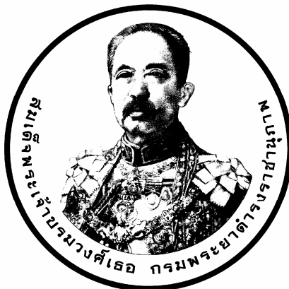
ภาพ ๑.๒ พระพักตร์ตรง (หันพระพักตร์ไม่เกิน ๔๕ องศา)