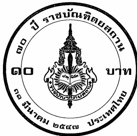
ภาพ ๑.๖ ด้านหลังเหรียญ

โดยที่รูปที่ปรากฏอยู่ในด้านหลังของเหรียญมักจะสอดคล้องกับเหตุการณ์สำคัญที่กระทรวงการคลังหรือหน่วยงานที่เกี่ยวข้องเห็นสมควรให้มีการออกเหรียญกษาปณ์ที่ระลึกในเหตุการณ์ดังกล่าวไว้ ดังนั้น รูปที่ปรากฏด้านหลังของเหรียญจึงเปลี่ยนแปลงไปตามเหตุการณ์การบรรยายจึงต้องพิจารณาดังต่อไปนี้