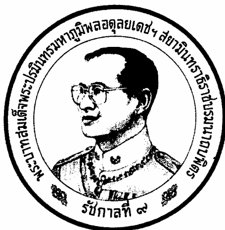
ภาพ ๑.๕ ด้านหน้าเหรียญ

เมื่อบรรยายลวดลายบริเวณกลางเหรียญเสร็จแล้วจะบรรยายลวดลายภายในวงขอบเหรียญ โดยเรียงลำดับจากเบื้องบนไปยังเบื้องล่าง และจากด้านขวาของเหรียญไปยังด้านซ้ายของเหรียญ หลังจากนั้นจะอธิบายลักษณะสิ่งที่น่าสนใจระหว่างข้อความ และริมขอบเหรียญ