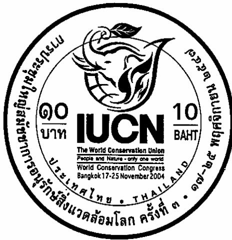
ภาพ ๑.๘ ด้านหลังของเหรียญ

ตัวอย่างเช่น “...ภายในวงขอบเหรียญเบื้องบนมีข้อความว่า “ครบ ๑๐๐ ปี โรงเรียนเสนาธิการทหารบก” เบื้องล่างมีข้อความว่า “๓ เมษายน ๒๕๕๒ ประเทศไทย” ด้านขวามีเลขบอกราคาว่า “๑๐” ด้านซ้ายมีข้อความว่า “บาท” (เรื่องเสร็จที่ ๖/๒๕๕๕) หรือ “...ภายในวงขอบเหรียญเบื้องบนมีข้อความว่า “ครบ ๑๒๐ ปี โรงพยาบาลศิริราช” เบื้องล่างมีข้อความว่า “๒๖ เมษายน ๒๕๕๑ ประเทศไทย” ด้านขวามีเลขบอกราคาว่า “๑๐” ด้านซ้ายมีข้อความว่า “บาท” (เรื่องเสร็จที่ ๓๑๘/๒๕๕๑) หรือ “...ภายในวงขอบเหรียญเบื้องบนมีข้อความว่า “ครบ ๑๒๕ ปี ไพรชนียไทย ๔ สิงหาคม ๒๕๕๑” เบื้องล่างมีข้อความบอกราคาว่า “๑๐ บาท” โดยมีจุดกลมคั่นระหว่างข้อความเบื้องบนกับเบื้องล่างทั้งสองข้าง” (เรื่องเสร็จที่ ๗๖๘/๒๕๕๑) หรือ “ด้านขวาของตัวเหรียญมีเลขบอกราคาว่า “๕” ด้านซ้ายมีข้อความว่า “บาท” และมีรูปสามเหลี่ยมด้านเท่าประกอบกันเป็นลวดลายโดยรอบซิดวงขอบ” (เรื่องเสร็จที่ ๒๙๓/๒๕๓๗) หรือ “...ภายในวงขอบเหรียญเบื้องบนมีข้อความว่า “รางวัลความสำเร็จสูงสุดด้านการพัฒนามนุษย์” เบื้องล่างมีข้อความว่า “๒๖ พฤษภาคม ๒๕๔๙ ประเทศไทย” โดยมีรูปปลายไทยคั่นระหว่างข้อความเบื้องบนกับเบื้องล่างทั้งสองข้าง” (เรื่องเสร็จที่ ๕๙๕/๒๕๔๙) หรือ “...เบื้องล่างรูปสัญลักษณ์มีข้อความว่า “ประเทศไทย” และ “THAILAND” โดยมีจุดกลมคั่นระหว่างข้อความดังกล่าว ด้านขวาของรูปสัญลักษณ์โดยมีเลขบอกราคาว่า “๑๐” และข้อความว่า “บาท” โดยมีเส้นคั่นระหว่างข้อความดังกล่าว ด้านซ้ายของรูปสัญลักษณ์มีเลขบอกราคาว่า “10” และข้อความว่า “BAHT” โดยมีเส้นคั่นระหว่างข้อความดังกล่าว...” (เรื่องเสร็จที่ ๗๔๖/๒๕๔๗)