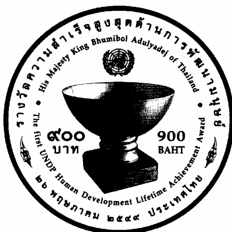
ภาพ ๑.๗ สัญลักษณ์องค์การสหประชาชาติ

(๒) กรณีเหตุการณ์ที่เกี่ยวข้องกับบุคคลโดยตรง มักจะปรากฏรูปดังนี้