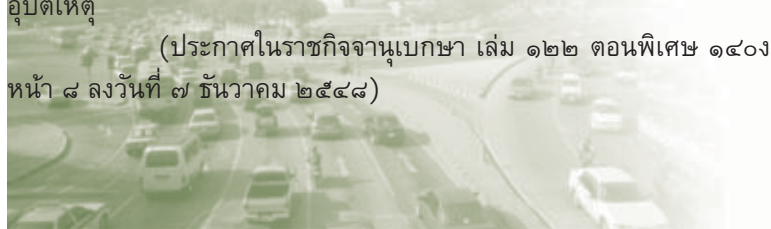
ศูนย์ข้อมูลกฎหมายกลาง